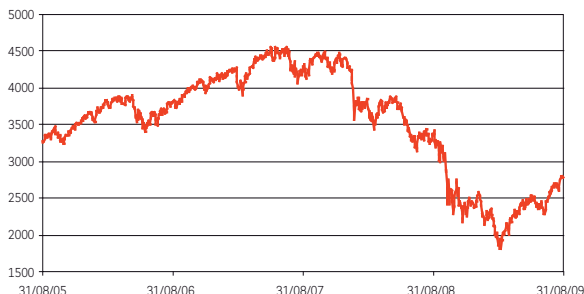
Evolution de l'indice sur les 4 dernières années

C'est l'évolution de l'indice Dow Jones Euro Stoxx 50 par rapport à son niveau initial, fixé le 16 octobre 2009, qui détermine la distribution des 3 derniers coupons et le mode de remboursement final.